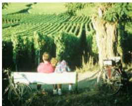
Die Pfalz – bekannt durch gute Weine und gemütliche Weindörfer