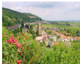
Die Pfalz – idyllisch im Sommer